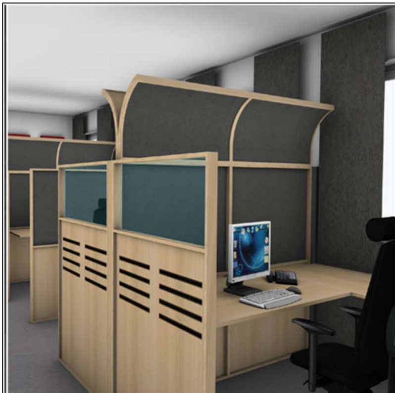
Bild 3 – modulära skärmar där kombinationer av avskärmning och ljudabsorption skapas.

https://kalls.se/produkter/kontor-konferens/kontorsmobler/skarmvagnar/skarmvagg-golv-silence-fanerfaner-800x1500-mm/