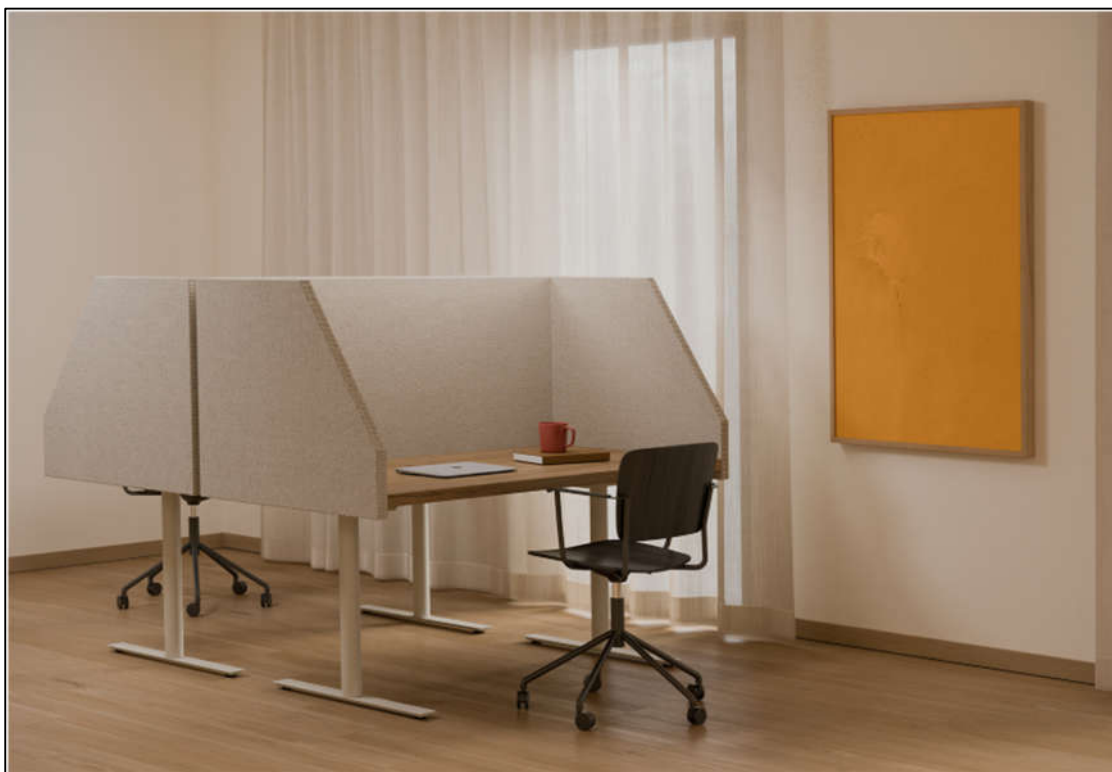
Bild 2 - Zilenzio Dezibel Table bordsskärmar, 60cm ovan skrivbord. https://zilenzio.com/sv/product/dezibel-table/

Golvmonterade skärmar är ge andra möjligheter till avskärmning. De är generellt tillgänglig med större höjd men rör sig inte med skrivbord som kan höjjusteras. Men med en höjd på 1,6-1,8m blir avskärmningseffekt inte bara bra ljudmässigt, man får också en okulär avskärmning så det blir färre störningar från rörelse av personalen.