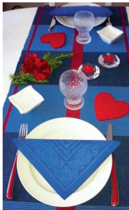
Romantisk dukning för två.