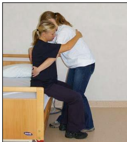
Stå framför patienten. Stötta patientens ena knä.