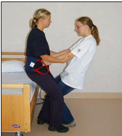
Gör nigning bakåt.