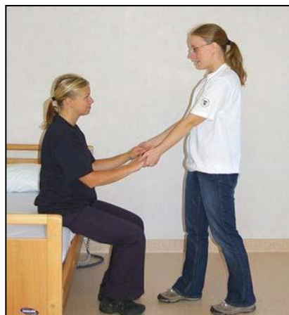
Stå i gångställning rakt mot patienten.