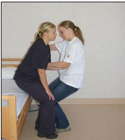
Gör nigning bakåt.