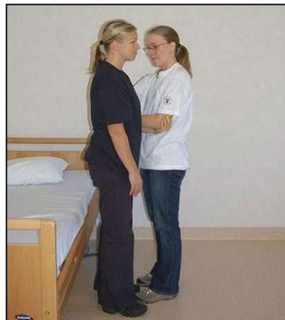
Sträck upp kroppen och stå kvar tills patienten har hittat balans.