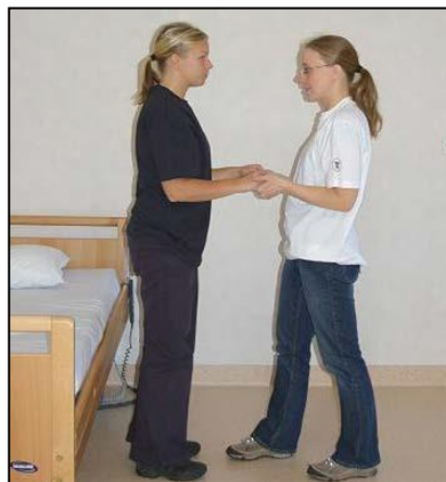
Sträck upp kroppen och stå kvar tills patienten har hittat balans.