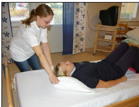
Om patienten har låg säng kan man använda kudden för att minska friktion