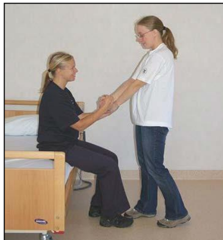
Stå i gångställning rakt framför patienten.