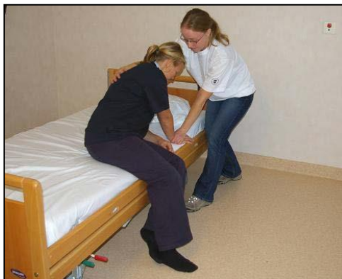
Backa bakåt och hjälp patienten att flytta med handen längs sänkkanten.