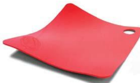
Antislip – antihalkmatta. Romedic AB.