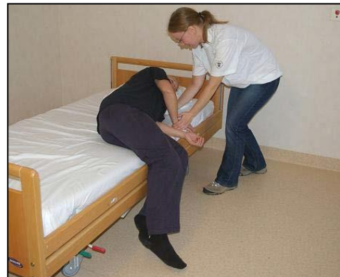
Guida patienten hela vägen ned till liggande. Patienten lyfter upp fötterna.