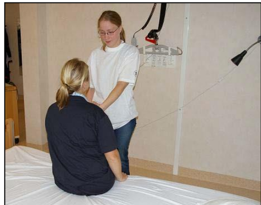
Håll kvar tills patienten har satt sig upp.