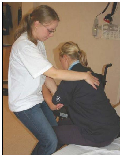
Lägg andra handen på patientens skuldra. Stötta knät på samma sida.