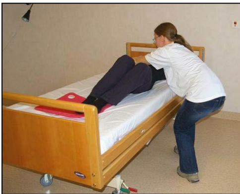
Bøj på benen så långt ned du kommer.