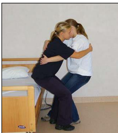
Gör nigning bakåt.