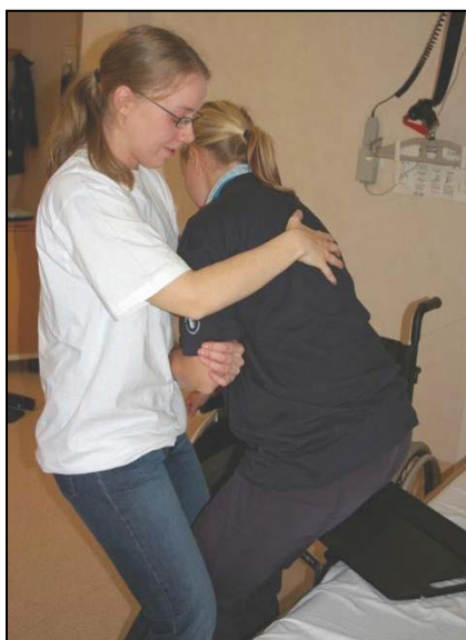
Gör tyngdöverföring bakåt.