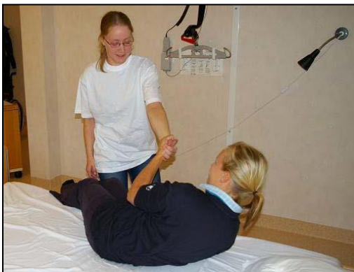
Patienten för över benen över kanten. Gör tyngdöverföring bakåt och låt patienten dra sig upp.