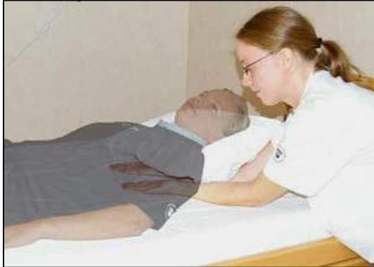
För in händerna under patientens skuldror.