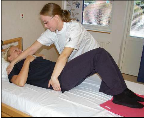
Placera händerna på pats skuldra och höft.