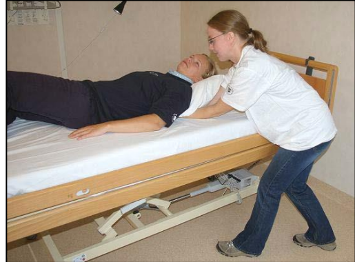
Stå i gångställning snett mot sängen i riktning mot fotänden