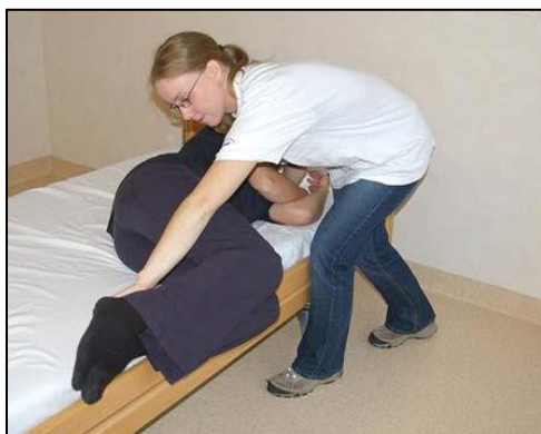
Patientens ben förs över sängkanten (om patienten inte kan göra det själv).