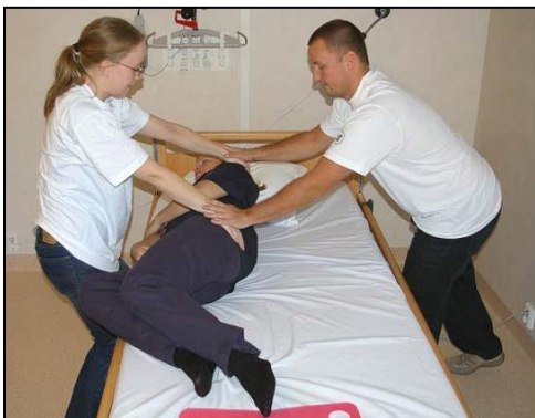
Kombinera med ”vändning från” Hjälpare 2 håller händerna på handlederna till hjälpare 1.