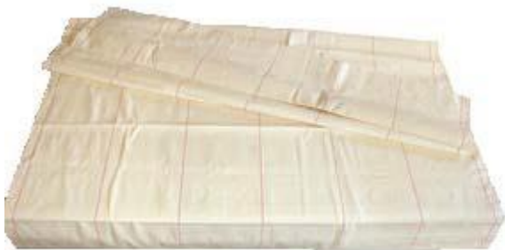
Draglakan i bomull 98x180 cm. Protecta Medical AB.