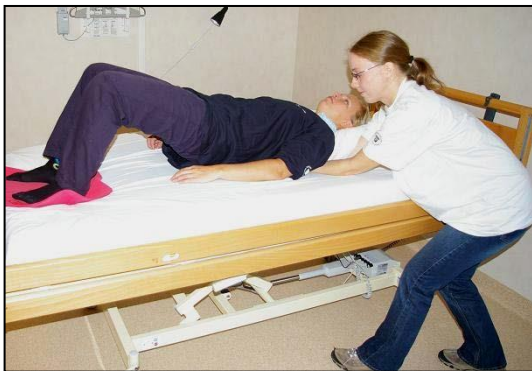
Be patienten att böja på benen och skjuta ifrån. Invänta medverkan.