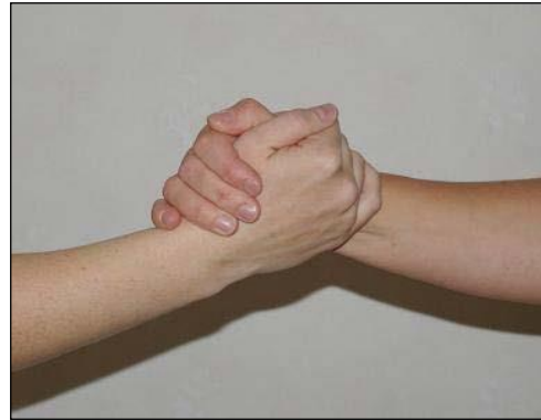
Tumbasgrepp utan tumme (tex vid smärta i tumlederna)