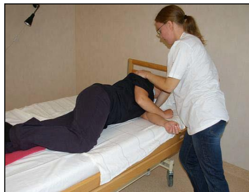
Rulla över patienten mot dig. Ta stöd av armbågen mot kroppen och skjut på den undre axeln med handen.