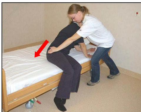
Ge tryck på höften i riktning framåt-nedåt. Följ med upp med en hand på skuldran. Pat trycker ifrån med handen mot madrassen.