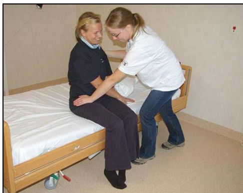
Fortsätt tills patienten sitter upp.