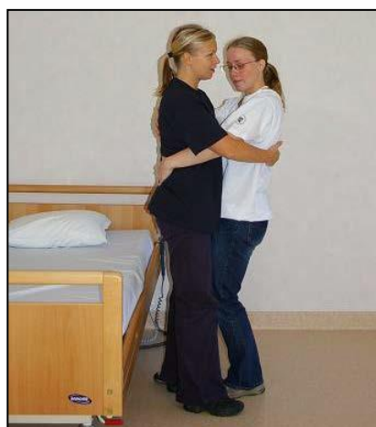
Sträck upp kroppen och stå kvar tills patienten har hittat balans.