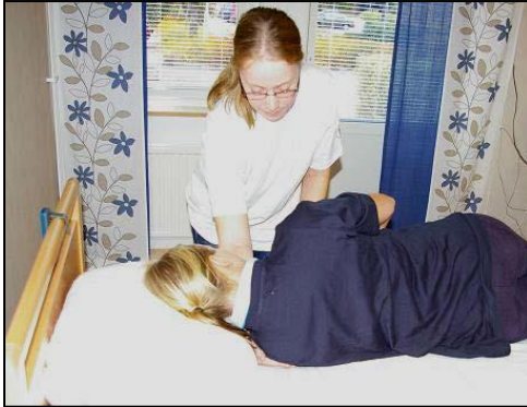
För in handen under patientens axel