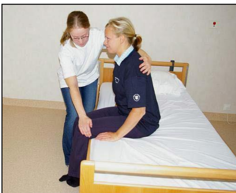
Rätta till knäna så att pat sitter rakt. Använd tyngdöverföring bakåt.