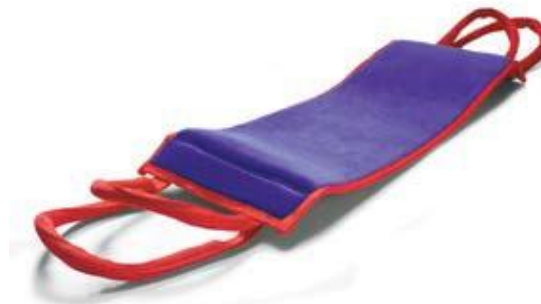
Fleximove 20x60 cm. Romedic AB.