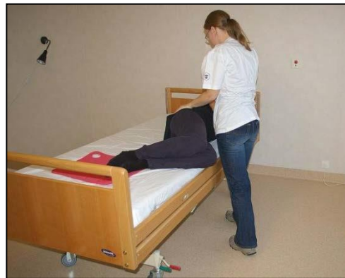
Sträck upp kroppen med raka armar.