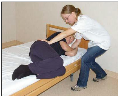
Placera handen på patientens höft och andra handen under patientens axel. Stå snett mot sängen i riktning mot fotändan.