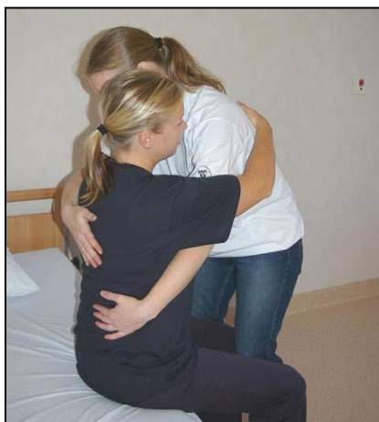
Lägg armarna runt patienten diagonalt.