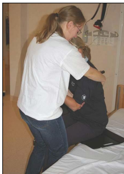
Flytta i tårtbitar över till stol.