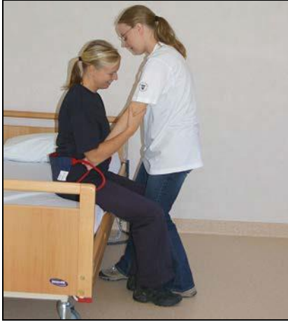
Placera fleximove långt ned bakom patientens bäcken Stötta patientens knä.