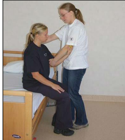
Stå framför patienten. Stötta knä.