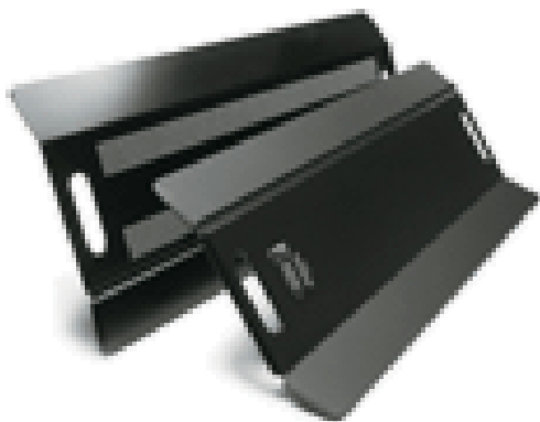
Easyglide – glidbräda 75 cm. Romedic AB.