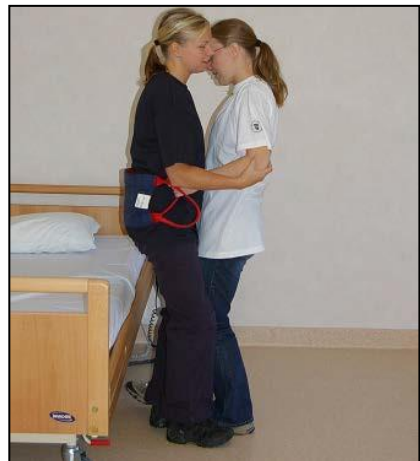
Sträck upp kroppen och stå kvar tills patienten har hittat balans.