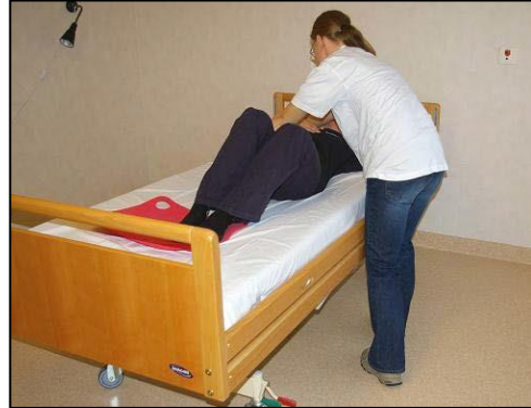
Stå i gångställning snett mot sängen i riktning mot huvudändan.