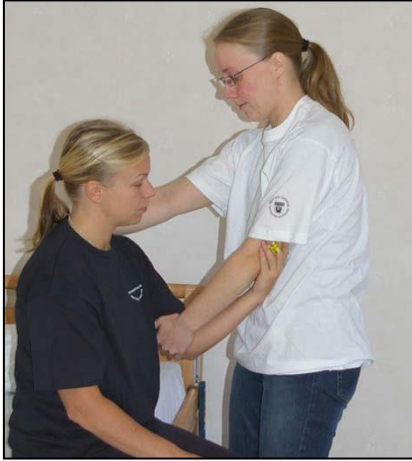
Använd armbågsgrepp. Andra handen på patientens rygg.