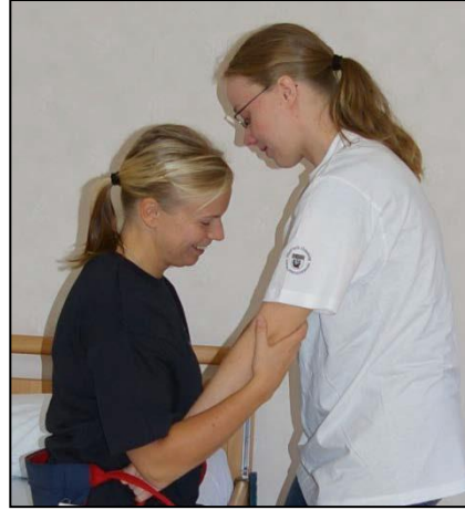
Patienten kan hålla på hjälparens armbågar.