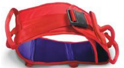
Flexibelt – vårdarbälte. Romedic AB.