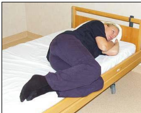
Patienten i sidliggande med böjda ben.