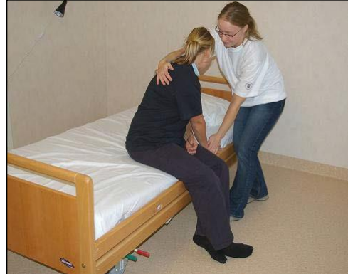
Stå snett mot sängen i riktning mot fotändan. Placera patientens hand på sängkanten.