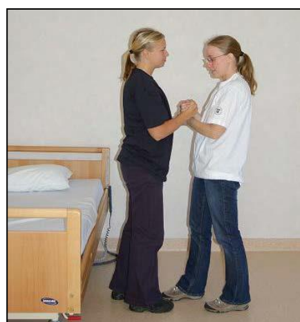
Sträck upp kroppen och stå kvar tills patienten har hittat balans.