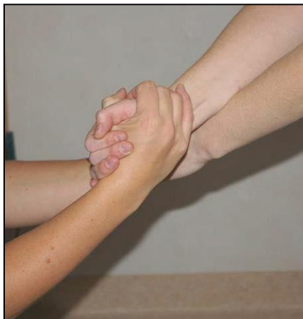
Använd tumbasgrepp med korsade armar.